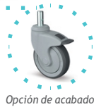
Opción de acabado